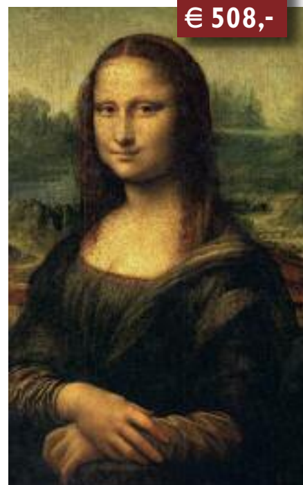
Leonardo da Vinci: Mona Lisa