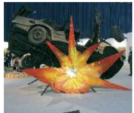
Kunst liefert explosiven Stoff für Diskussionen!

Stadtführung intensiv: zum Thema „Badische Revolution“, Stadtführung „Jugendstil“ oder „Dammerstocksiedlung“