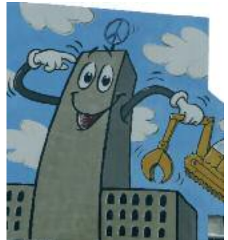
Der Bahnhofsturm wehrt sich gegen den Abriss (Plakat vom Bauzaun)