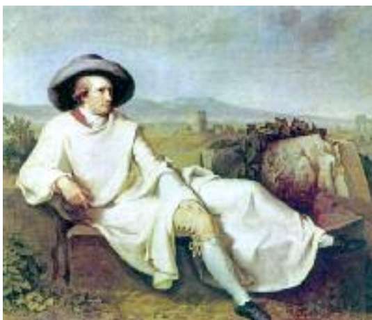
Johann Heinrich Wilhelm Tischbein: Goethe in der römischen Campagna (Städel Frankfurt–Main)

Wir wollen Sie mit außergewöhnlichen Angeboten, erstklassigem Service und speziellen Themenreisen begeistern. Kunstreisen heißt: Abstecher in bedeutende Metropolen und Landstriche unternehmen, Ausstellungen von Weltrang besuchen, exklusive Kunst- und Kulturevents erleben. Doch überzeugen Sie sich selbst: einen Reisespezialisten in Ihrer Nähe finden Sie mit Hilfe Ihrer Postleitzahl auf unserer Website.