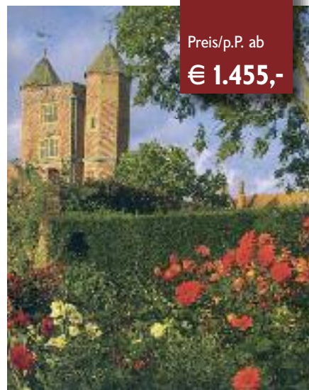
Sissinghurst: Vita Sackville-West schuf den populärsten Garten Englands