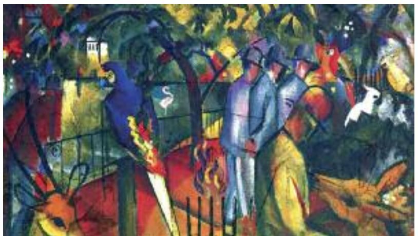
August Macke: Zoologischer Garten, 1912 (Städtische Galerie im Lenbachhaus München)