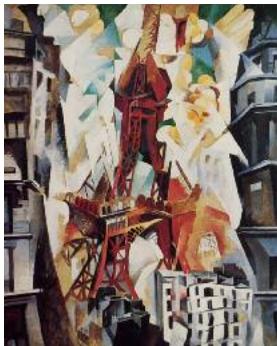
Robert Delaunay: Eiffelturm, 1911