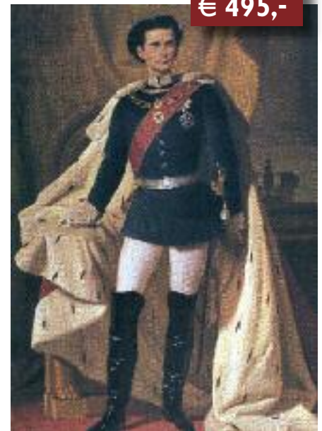
Piloty d.J.: König Ludwig II. mit Krönungsmantel