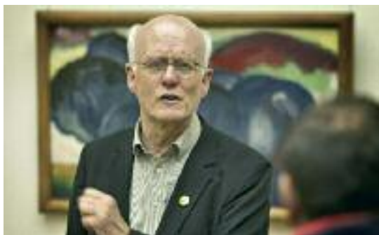
Wir sprechen mit Ihnen über Bilder und Kunst