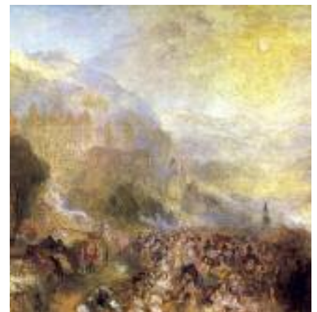
Joseph Maillord William Turner: Heidelberg 1844 – 1845