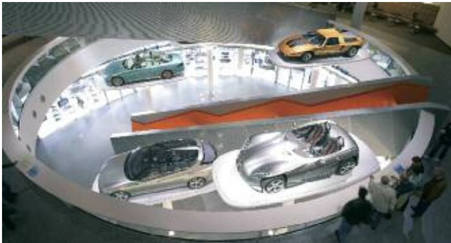
Automobile Träume im futuristischen Mercedes-Museum

Erleben Sie Stuttgart und die Region ganz nach Ihren individuellen Interessen und Wünschen. Wir bieten Ihnen dafür viele interessante Bausteine, die Sie entweder einzeln oder in Kombination buchen können. Gerne sind wir Ihnen bei der Buchung behilflich und erstellen ein persönlich auf Sie zugeschnittenes Programm.