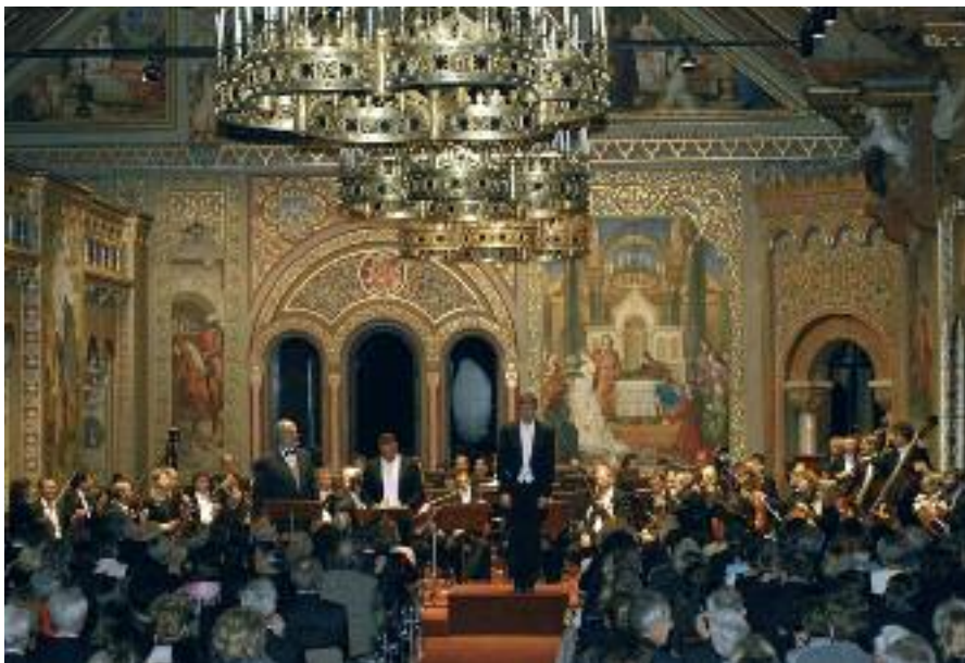
Nicht im Eiltempo durchgeschleust werden: Konzert im Sängersaal Schloss Neuschwanstein