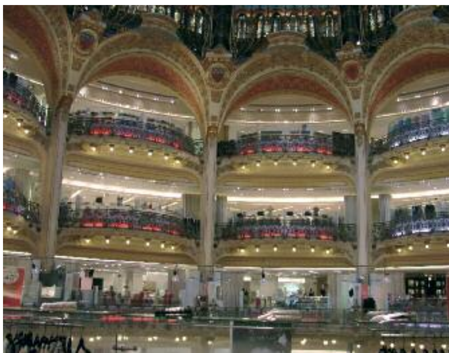
Galeries La fayettes: Konsumtempel im Weihnachtsschmuck