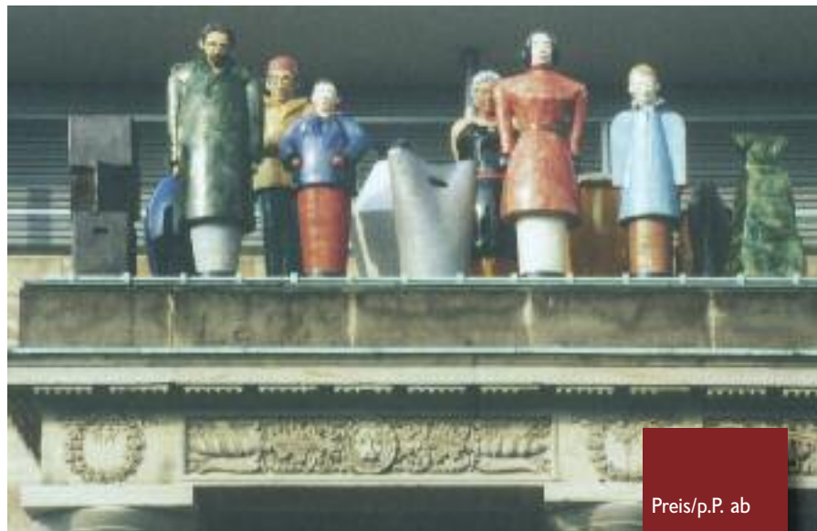
Thomas Schütte: Die Fremden, 1992 (documenta IX, 1992)

der bahnbrechende Erfolg nicht absehbar. In der Ruine des zerstörten Museums Fridericianum präsentierte Arnold Bode 1955 Werke der klassischen Moderne, die während des Faschismus nicht gezeigt werden durften. Und schon damals kamen 130.000 Kunstinteressierte in die wunderbare Karlsaue. Zur letzten documenta 2007 pilgerten 750.000 Gäste. Auch 2012 sollte man sich dieses hochinteressante Event nicht entgehen lassen.