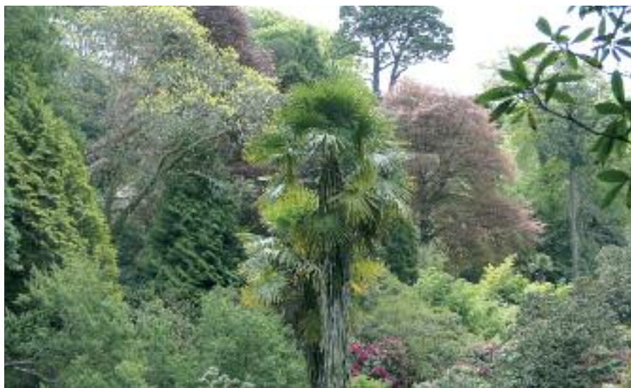
Trebah-Garden: Ein ganzes Flusstal wurde vor mehr als 100 Jahren zum Dschungelgarten

von Beachy Head macht auch die großartige Küstenlandschaft erfahrbar, übernachten werden Sie im Seebad Eastbourne in einem Traditionshotel. Der zweite Teil der Reise führt nach Cornwall. Unterwegs gewinnen Sie in Hestercombe Gardens einen Eindruck von der raffinierten Gartenkunst Gertrude Jekylls, die über 400 Gärten gestaltete. Der Fischer- und Badeort St. Ives war ein Magnet für britische Künstler im 20. Jahrhundert. Die Tate baute daher eigens ein Museum in St. Ives. Dazu gehören auch der Gallery Skulpturengarten und die Ateliers der Bildhauerin Barbara Hepworth. Zudem lässt der Golfstrom in Cornwall subtropische Raritäten gedeihen, die im 19. Jahrhundert von viktorianischen Pflanzen-Expeditionen aus Südamerika, Australien und Asien importiert wurden. In den Gärten begeistern daher Riesenfarne und – besonders im Mai – die Farborgien baumhoher Rhododendren. Sie bestaunen den „Dschungel“ und die Rhododendren im Lost Garden of Heligan und das traumhafte Parktal von Trebah. Enden wird die Reise zwischen den Ateliers und Skulpturen Henry Moores auf seinem Landsitz in Perry Green.