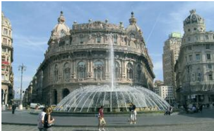
Piazza de Ferrari in Genua

der Altstadt wurden 2006 zum UNESCO-Weltkulturerbe erklärt. Die Gemäldegalerien in den Palästen „Rosso“ und „Bianco“ zeugen mit bedeutenden Werken von Rubens und Van Dyck und vielen anderen Künstlern vom Reichtum der Stadt. Abends laden uns die Restaurants in der Altstadt zum Schlemmen ein. Genua ist schließlich die Heimat des berühmtesten Gerichts Liguriens: Pesto alla Genovese. Unser willkommener Anlass, Genua zu besuchen, ist die Konzertreise des Johann-Sebastian-Bach-Ensembles unter der Leitung von Helmuth Rilling mit Bachs h-Moll-Messe. Und wollten Sie schon immer mal die wunderbare Landschaft der Cinque Terre sehen? Dann sollten Sie unbedingt mitreisen. Denn einen Tag lang entdecken Sie die schönste Landschaft Liguriens, der zum Weltkulturerbe erklärten Cinque Terre: Fünf in Felsnischen eingestützte Dörfer, dazwischen 7.000 km Trockenmauern an steil ins Meer fallenden Wein-, Oliven- und Ginsterhängen. Glücklicherweise sind die Orte der Cinque Terre nur mit dem Zug oder zu Fuß zu erreichen. Wer will, kann nach der Zugfahrt an einer kleineren Wanderung teilnehmen.