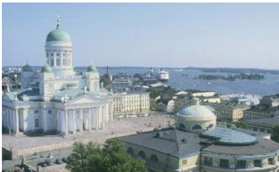
Die klassizistische Architektur gab Finnlands Hauptstadt den Namen: „Weiße Stadt des Nordens“.

Aino Aalto, des Malers Akseli Gallen-Kallela und in Hvitträsk das des Architekten Eliel Saarinen sehen. Weitere Museen des Designs, der Architektur und der Kunst laden ein, die interessante Kultur Finnlands kennenzulernen. Das Design hat in Helsinki eine lange Tradition und seit jeher seine Wurzeln im Alltagsleben: in Design-Vierteln mit ihren kleinen Läden, die zum Schauen einladen, in Events, während der jedes Jahr stattfindenden Helsinki Design Woche, in den Excellenceuniversitäten und in der Wirkung auf die wirtschaftliche Entwicklung der ganzen Stadt, z.B. in Firmen wie Marimekko, Nokia und Kone. So wurde die Stadt für 2012 nun vom International Council of Societies of Industrial Design (Icsid) zur 3. Welt-Designhauptstadt der Welt – nach Turin und Seoul – ausgewählt. Ein Abstecher nach Tallinn, das alte Reval, gegenüber dem Finnischen Meerbusen, eine der schönsten Städte des Baltikums, führt uns mit dem Domberg und der Unterstadt (UNESCO-Weltkulturerbe) in die Zeit des Mittelalters zurück. Auch hier laden die kleinen Handwerksläden zum Bummeln ein.