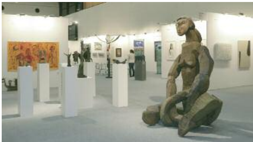
Nicht planlos durch die Kunstmesse irren, sondern von Kunsthistorikern mehr erfahren

Reisetermin: Sa. 10.03. – So. 11.03.2012