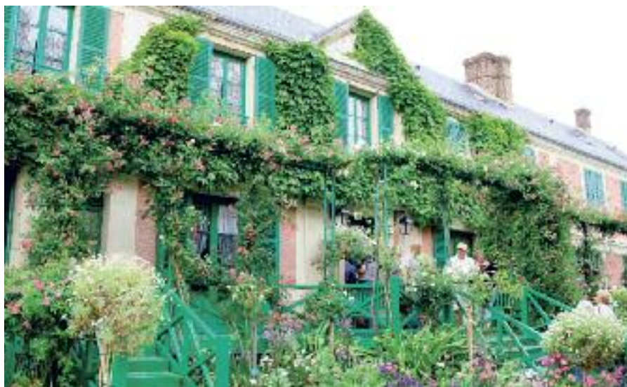
Das Haus im normannischen Stil, in dem Claude Monet mit seiner großen Familie lebte

Nachlass, in der Orangerie seine großformatigen Seerosenpanoramen und im Musée d'Orsay, dem einstigen Prachtbahnhof, einen Überblick über sein Gesamtwerk. Dort werden Sie sich zudem mit den Impressionisten allgemein befassen sowie mit Beispielen jener Salonmalerei, gegen die die jungen Impressionisten rebellierten. Im Musée Rodin sehen Sie an den Werken Rodins und seiner zeitweiligen Mitarbeiterin und Geliebten Camille Claudel, was Impressionismus in der Bildhauerei bedeutet. Bei einem Spaziergang am Montmartre entdecken Sie legendäre Orte, an denen Renoir, Picasso, van Gogh und andere namhafte Künstler lebten und arbeiteten. Höhepunkt der Reise ist der Ausflug in die Normandie: der Besuch des Gartens von Giverny, der im Sommer in intensiven Farben blüht, eine Bootsfahrt in der Auenlandschaft der Seine und der Abend mit Dinner und klassischem Konzert in einem traumhaften Kulturzentrum mit historischer Mühle, Park und Orangerie an der Seine.