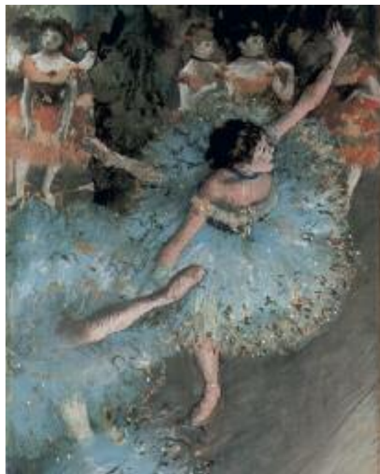
Edgar Degas: Die grünen Tänzerinnen, 1877-1879 (Sammlung Thyssen-Bornemisza, Madrid)

Schnell und wirtschaftlich. Die Anreise per Flugzeug. Oft sind tagesaktuelle Flugpreise günstiger als eine Bahn- oder Autoanreise. Fragen Sie uns nach Bestpreis-Konditionen. Gerne buchen wir für Sie.