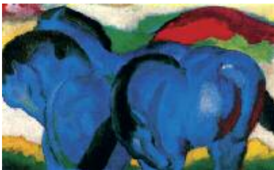
Franz Marc: Die kleinen blauen Pferde, 1911