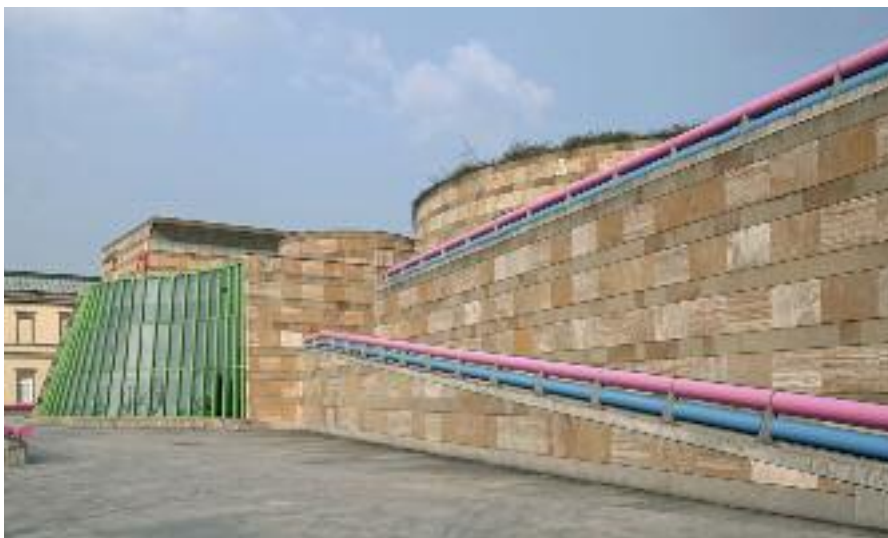
Stuttgarter Staatsgalerie, Sterling Neubau

Mit uns können Sie selbst entscheiden, wie Ihr perfektes Kunsterlebnis aussehen soll. Wählen Sie zwischen einer Reise, bei der wir schon alles für Sie vorbereitet und organisiert haben oder stellen Sie sich Ihr Programm aus verschiedenen Bausteinen zusammen. Wir beraten Sie gerne!