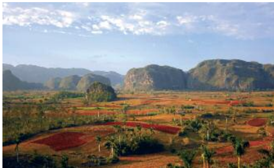
Das Tal von Vinjales: Palmen und Tabakanbau, bizarre Felsen und Kunstprojekte